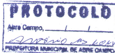
_____ Márcio Moreira Vítor Prefeito Municipal